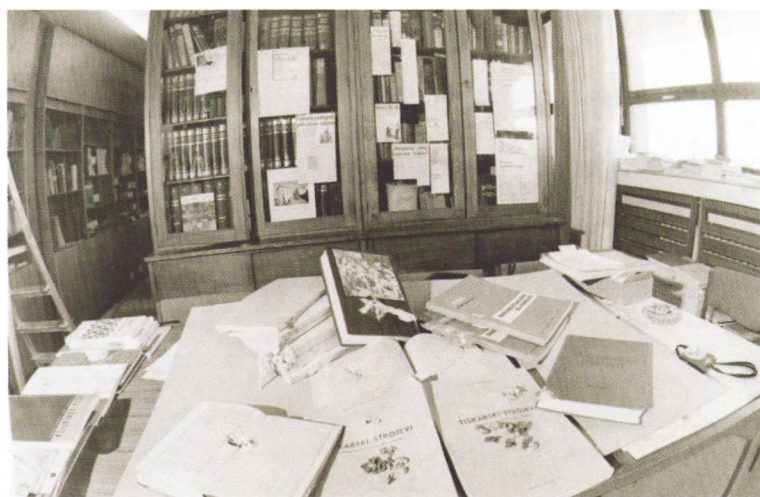
Oštećenja u knjižnici Hrvatskog hidrografskog instituta