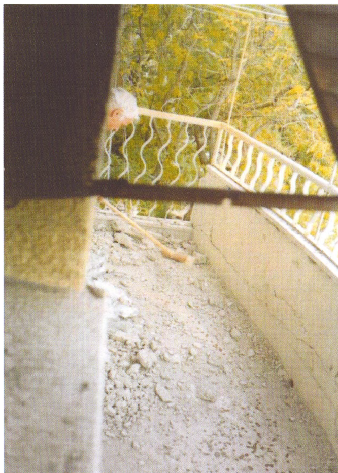
Oštećenja u stanu obitelji Matošić