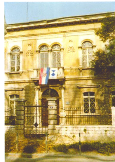
Bivša zgrada Sveučilišne knjižnice