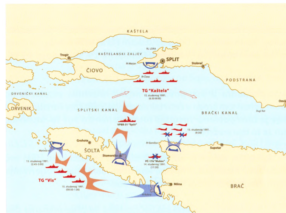
Prikaz događanja u Splitskom kanalu 14. i 15. studenoga 1991.

Zanimljivost je, kako je razarač Split (VPB- Split ) okončao svoju sudbinu 2013. u albanskom rezalištu, dok je Mukos nakon remonta, pod novim imenom Šolta , već 1993. stavljen u operativnu upotrebu u Hrvatskoj ratnoj mornarici , a danas je u Obalnoj straži RH .